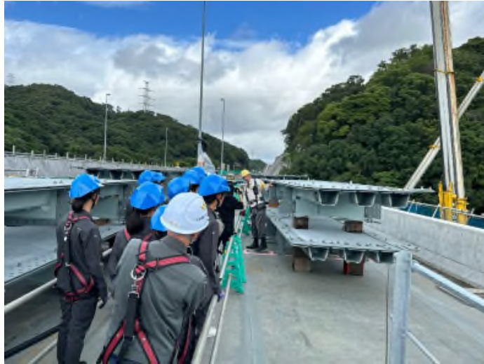
降っていた雨も、見学中は止んでくれました