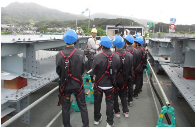
現場見学会の様子

2023年9月21日、当社が西日本高速道路株式会社（NEXCO 西日本）から受注し施工中の「相浦川橋鋼上部工工事」（長崎県佐世保市）において、現場見学会を開催しました。見学会には、交通インフラの整備が進む様子を実際に見ることで鉄構業界への興味を深めてもらうことを目的に、長崎大学工学部社会環境デザイン工学コースの学生48名と教職員4名を招待しました。